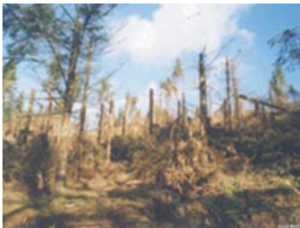
3. Une forêt de la Creuse après la tempête (site de l'IFN)

http://www.promethee.com/promethee/ : un site plaisamment baptisé Prométhée, sur les incendies de forêt en France méditerranéenne. Malgré une qualité assez médiocre des graphiques proposés, de bonnes statistiques et un moteur de recherche par année ou département.