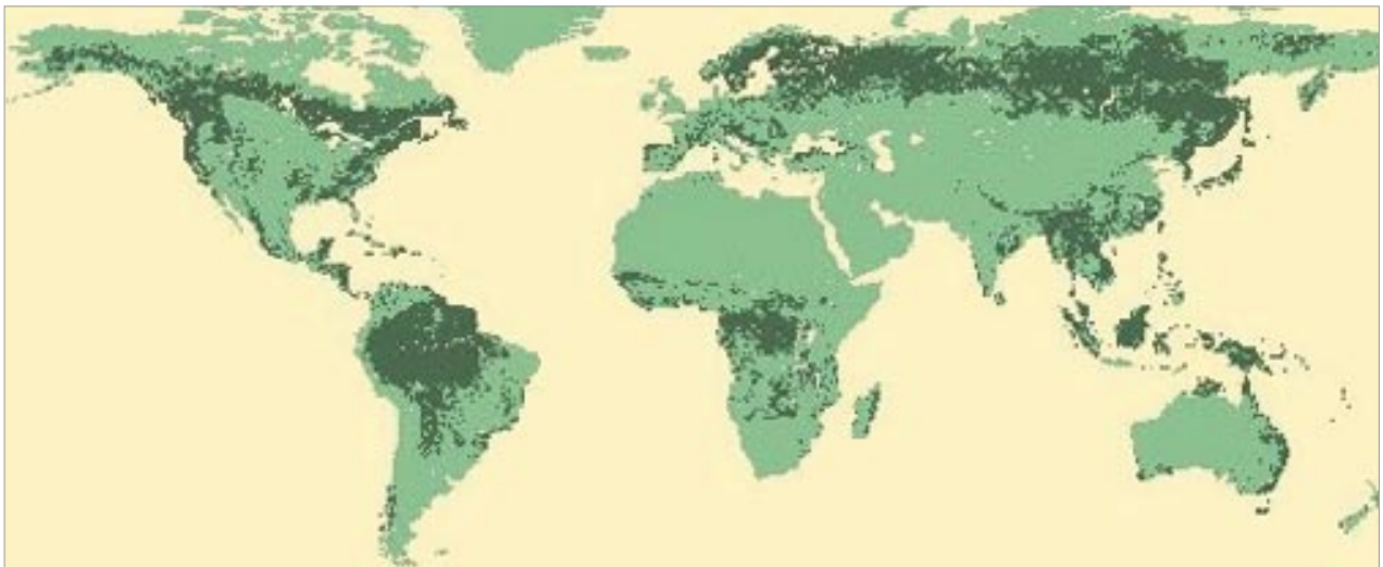
1. Les forêts dans le monde (site de la FAO)

http://www.europarl.eu.int/workingpapers/agri/default_fr.htm : le site du Parlement européen propose une synthèse très complète sur les forêts, publiée de 1994 à 1998 et intitulée, de manière un peu restrictive, L'Europe et la