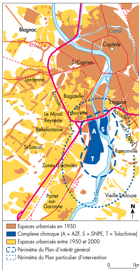
1. Des usines hors la ville, jadis

deux-guerres, la ville gagne certes du terrain, avec en rive gauche les lotissements de la Croix de Pierre et de la Faourette et, de l'autre côté de la Garonne, le démarrage d'un programme d'habitations à bon marché (HBM) dans le quartier d'Empalot. Mais jusqu'aux années 1950, l'urbanisation des abords immédiats du pôle chimique reste très incomplète (fig. 1).