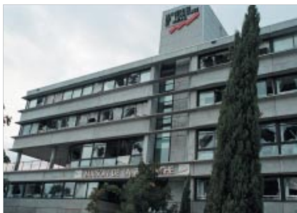
4. La Maison de la Recherche (Université du Mirail), bâtiment abritant le CIEU, auteur de l'article...

Justement, une grande partie du débat local se focalise sur le maintien ou non de la chimie dans la ville. Les associations les plus en pointe réclament un arrêt définitif de l'activité