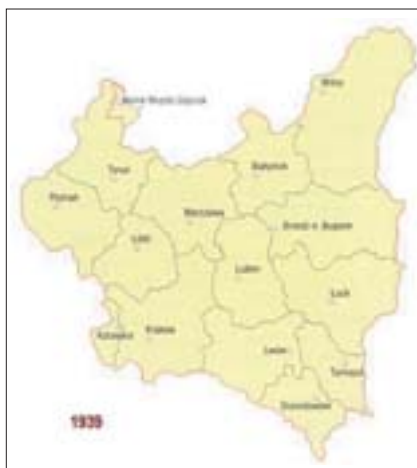
2. La Pologne en 1939

http://www.paiz.gov.pl/ : le site de la Polish Agency for Foreign Investments (PAIZ) fournit d'utiles renseignements économiques. On pourra consulter la rubrique « Why Poland ? » qui fait le point (de façon un peu partisane il est vrai) sur l'intérêt à investir dans le pays. Un intéressant schéma sur la situation de la Pologne en Europe, un « pont entre l'est et l'ouest ». – Christophe Clavel