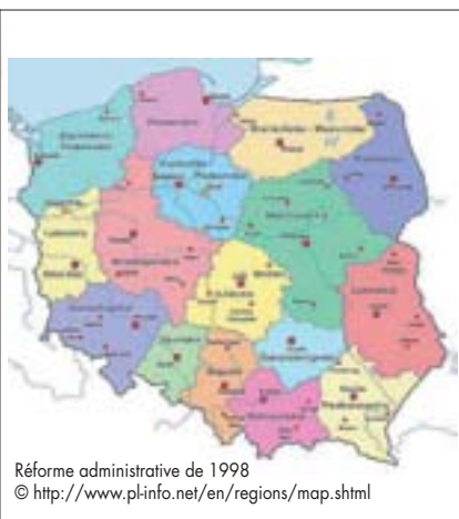
Réforme administrative de 1998