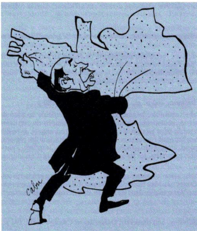
Avant le 16 mars 1986...