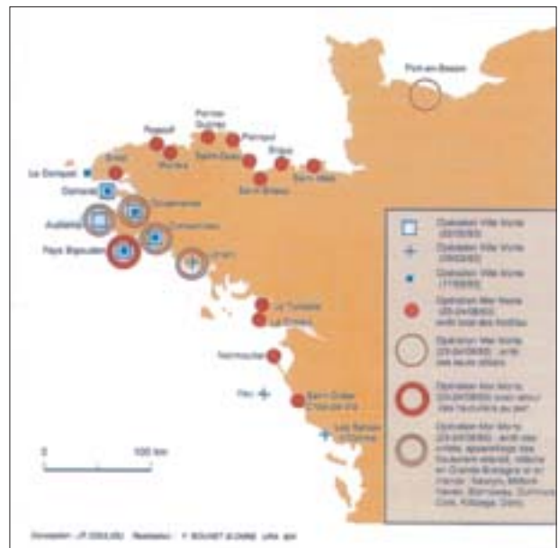
2. Les grandes journées de revendications des marins pêcheurs en 1993

Une publication (1) soignée, qui reprend le modèle de Mappemonde (priorité à la carte et texte en mineur) avec des numéros ordinaires et des numéros à thème, et dont la périodicité n'est pas encore indiquée. Ce numéro «1» balaie un grand nombre de champs thématiques, et une grande variété d'outils. On relèvera, parmi les premiers, les conflits de la pêche en 1993 et 1994 (pp. 11-12) (fig. 1 et 2), les ports de l'Arc atlantique en 1992 (p. 19): mais la logique interne de l'arc n'apparaît pas dans la carte ni dans le commentaire. De même, la carte des captures en Europe (p. 7) devrait si possible discerner des sous-ensembles hors «CEE»: Scandinavie, Europe centrale par exemple. La capture par pays se mesure-t-elle en flottille de pêche ou port de débarquement? Pour renseigner le lecteur ordinaire, la particularité du thème de la mer supposera une explication minutieuse des définitions.