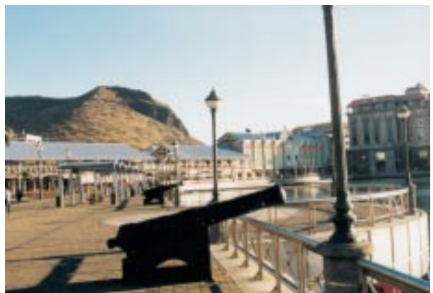
2. Le Waterfront de Port Louis, avec l'esplanade Bissondayal au premier plan prolongeant le Caudan Waterfront au second plan

La ville a su saisir, dans la restructuration du port, une opportunité pour se réconcilier avec son front de mer et de renouveler son centre ancien, à l'étroit et vétuste. L'opération de reconquête du port est passée par trois grands projets, dont deux sont achevés.