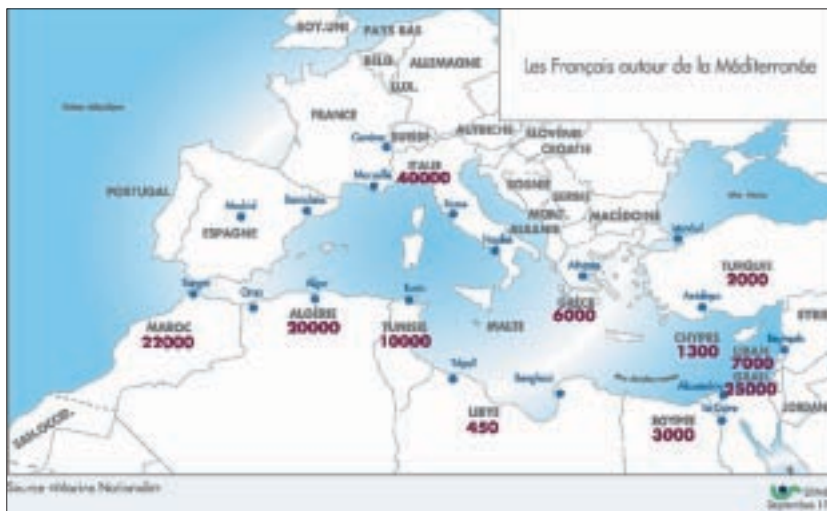
1. Les Français autour de la Méditerranée ( http://www.marseille-innov.asso.fr/AMM/16.html )

• Données climatiques : http://www.worldclimate.com/ Remarquable site, qui donne les températures et les précipitations d'une immense quantité de stations dans le monde. Plus de 85 000 séries disponibles. De quoi étudier assez précisément les nuances climatiques entre les différentes régions de la Méditerranée. – Christophe Clavel