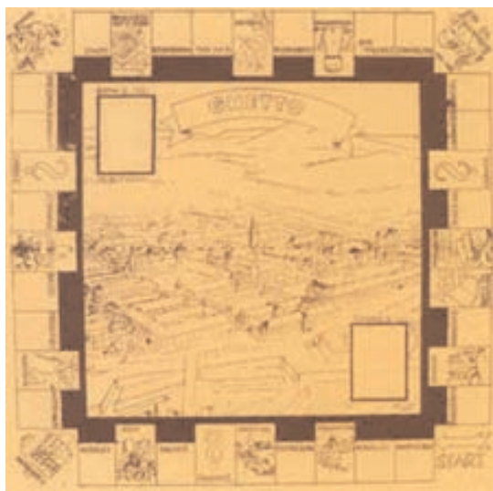
2. Plateau de jeu artisanal , réalisé pendant la 2 e guerre mondiale dans le ghetto de Theresienstadt, en Tchécoslovaquie

Les cent ans du métro parisien furent l'occasion de créer une nouvelle version appelée « Métropoly ».