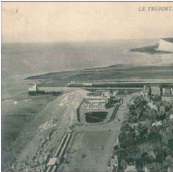
4. Blocage des galets par la jetée du Tréport, 1905 (détail), 1997