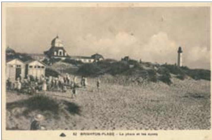
3. L'ensablement devant le casino de Brighton, 1905, 1930, 1946

rivage. Les apports de sables venus du sud-ouest ont réduit les débits de chasse d'eau, donc l'ampleur des divagations ; ils ont ainsi remonté à l'intérieur de la baie, et repoussé le chenal vers le nord. Mais les courants de marée sont encore