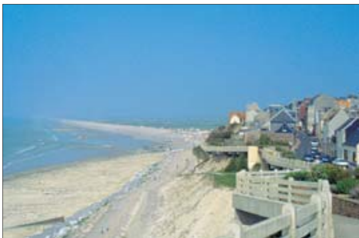
2. Le site d'Ault-Onival, 1905, 1997