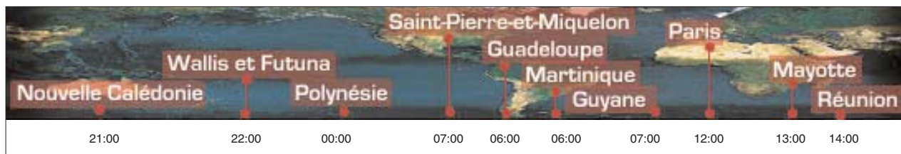
Le bandeau de présentation de la radio RFO avec affichage permanent des heures locales ( http://www.rfo.fr/ )

Site de la rubrique : http://www.mgm.fr/Mappemonde Courrier électronique : Mappemonde@mgm.fr