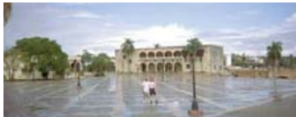
Saint-Domingue : l'Alcazar de Colón ( http://www.aart.com/domrep/santo.htm )

• Autre site, celui de l'Institute of Latin American Studies de l'université du Texas : http://www.lanic.utexas.edu .