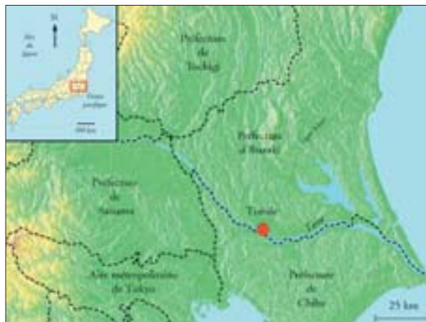
1. Localisation de Toride

Les campagnes du Kanto face à la croissance de Tokyo. – Le Kanto est un terrain d'observation privilégié pour comprendre les phénomènes qui conduisent les espaces ruraux japonais de la société agrorurale à la société périurbaine.