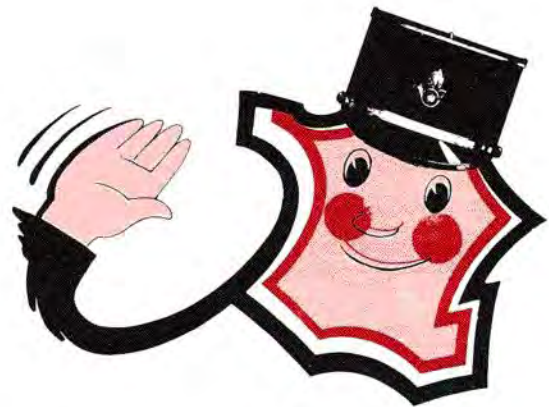
« Qu'avez-vous à déclarer ? » Ici l'hexagone rhabillé en douanier, souhaite la bienvenue aux étrangers.