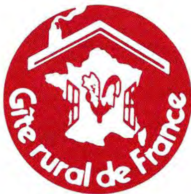
Une chaumière et un coq ; un toit partie d'hexagone, abrite la France des gîtes.