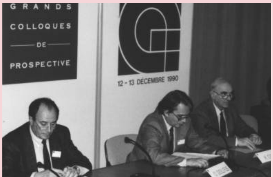
Franck Auriac (à gauche) avec Olivier Dollfus et Hubert Curien au Grand colloque de prospective du ministère de la Recherche.

L'évaluation prospective des territoires, le traitement statistique, graphique et cartographique de l'information spatialisée, les outils et méthodes préalables et indispensables à toute étude de